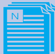
ОҚУ БАҒДАРЛАМАСЫНЫҢ НҰСҚАУЛЫҒЫ